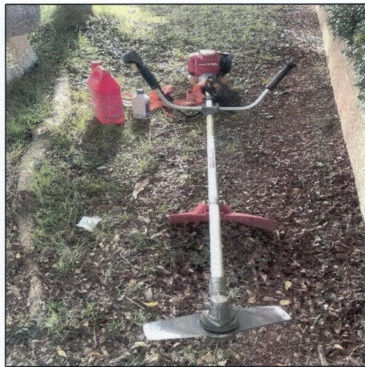
๒๗. เครื่องตัดหญ้าแบบข้อแข็ง